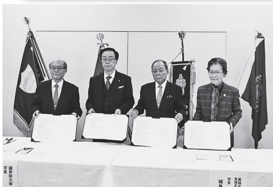
締結式に臨む「渋谷4大学」の各大学学長（実践女子大学）