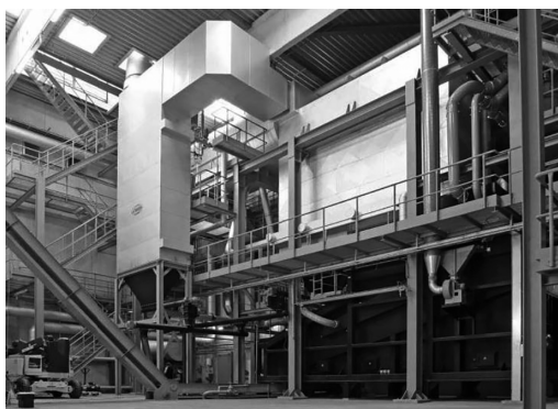
「竹専焼バイオマス発電プラント」(藤崎電気)

出雲市 11月6日、同市は市内の白枝荒神遺跡で、1世紀後半頃に中国で作成されたものと思われる青銅鏡の破片、「破鏡」が出土したと発表。破鏡の出土は以前から九州で多かったが、県内の弥生時代集落からの出土