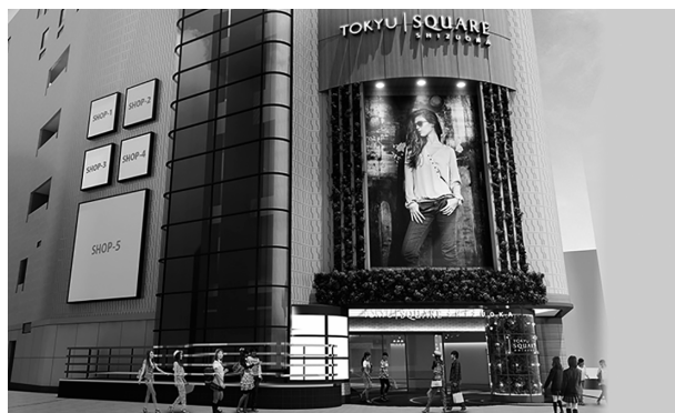
「静岡東急スクエア」イメージ(東急モビルズデベロップメント)