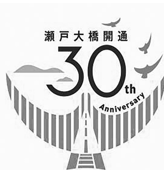
瀬戸大橋開通30周年のロゴマーク(岡山県)