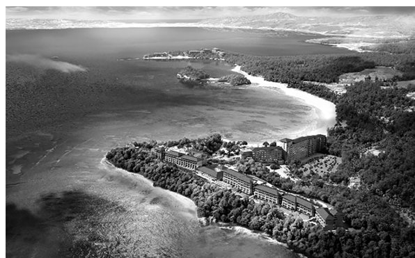
「ハレクラニ沖縄」のイメージ(三井不動産)

ハワイ・ワイキキビーチの高級ホテルブランドだが、海外への進出は今回が初。全長約1・7kmキロの海岸線に面した立地で、敷地面積約