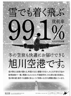
「就航率99・1%」を謳った旭川空港のポスター(旭川空港ビル)