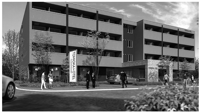
「富岡ホテル」イメージ(富岡ホテル)

施設はビジネスホテル・タイプで、鉄筋コンクリート製の地上4階、69室(シングル66、ツイン3)、1泊7300円(朝食つき)。